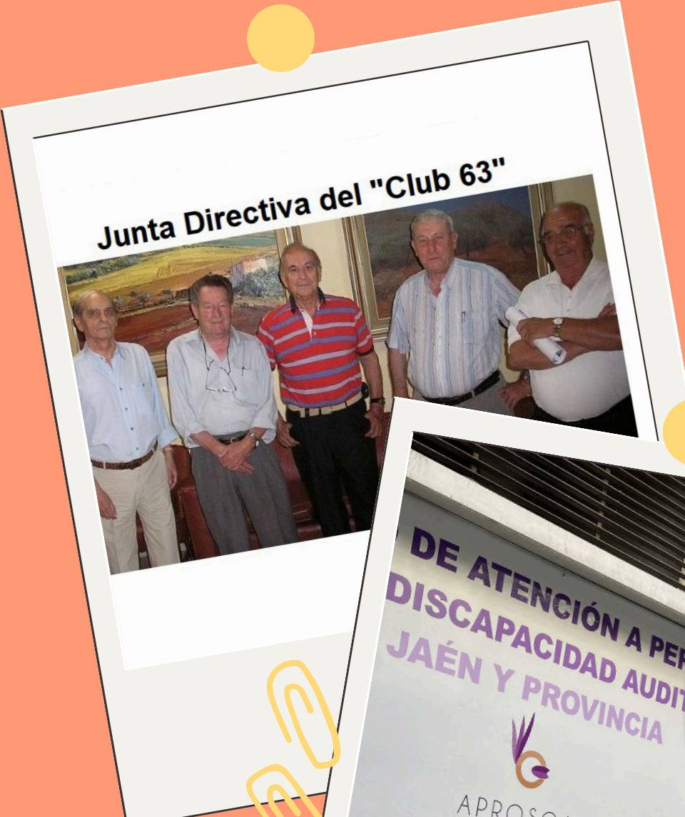
Junta Directiva del "Club 63"